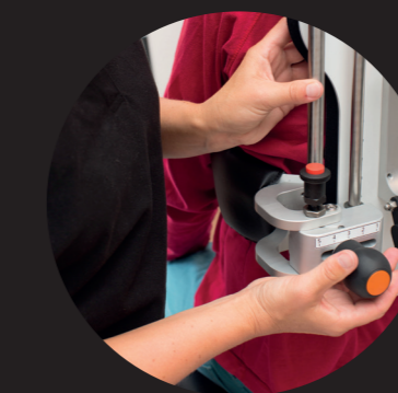
Einfache Anpassung an unterschiedliche Patienten.