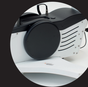
Kontinuierliche motorisierte Bewegung der Beine mit Gewichtsübernahme.

INNOWALK PRO MEDIUM 130 – 180 CM MAX. 75 KG