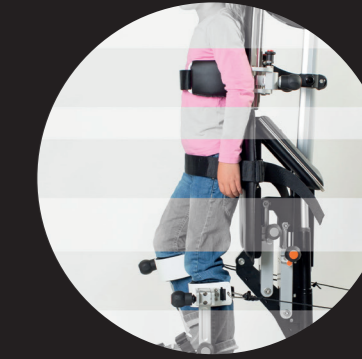
Haltepunkte an Rumpf, Becken und Beinen korrigieren die Körperhaltung und geben Sicherheit.