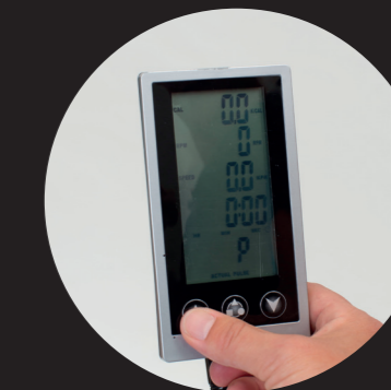
Display zur Anzeige der Schritte, Geschwindigkeit, Dauer und zurückgelegten Strecke.